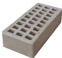
Кирпич керамический лицевой пустотелый одинарный цвет «Серебро»