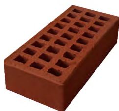
Кирпич керамический лицевой пустотелый одинарный, цвет «Красный»