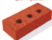
Кирпич керамический полнотелый лицевой, одинарный цвет «Красный»