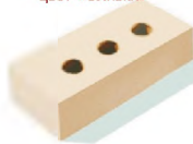
Кирпич керамический полнотелый лицевой, одинарный цвет «Сливки»