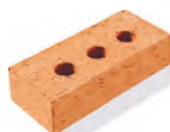
Кирпич керамический полнотелый лицевой, одинарный цвет «Осенний лист»